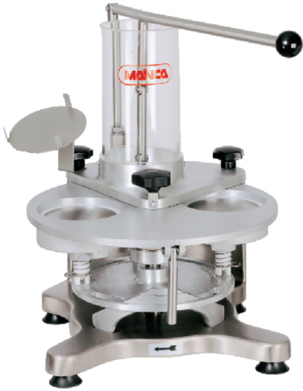
MH-100 / MH-120 / MH-130