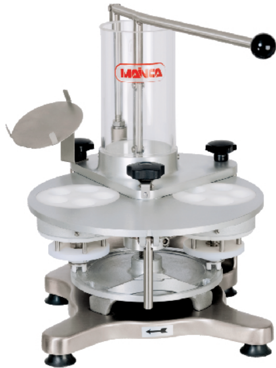
MA-5 / MA-10